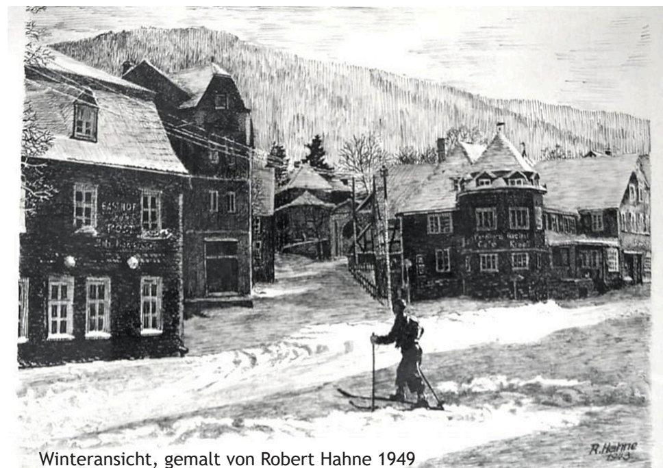
Winteransicht, gemalt von Robert Hahne 1949