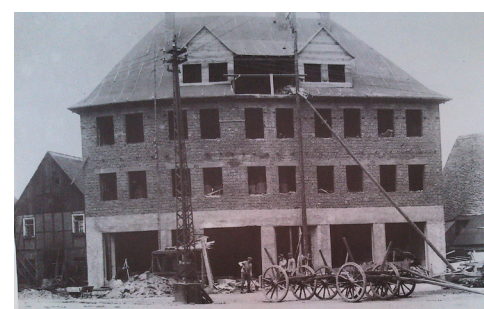
Bau des Hochhauses 1928-1929