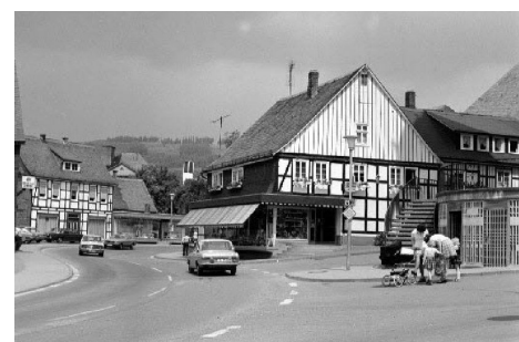
Umfeld Kirche 1970er Jahre