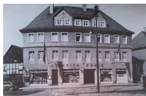
Das Hochhaus um 1935