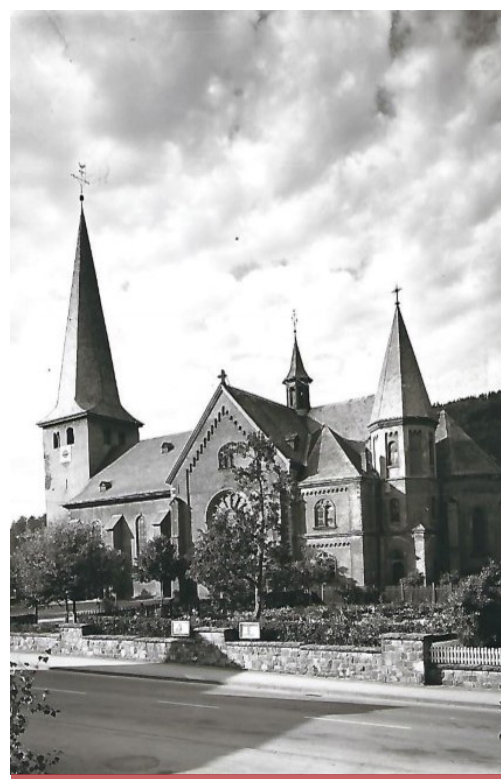
Die Kirche vor der Renovierung.